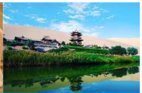
สระน้ำวพระจันกรี