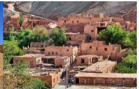
หมู่บ้านอุยกูร์