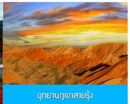
อุทยานภูเขาสายรุ้ง