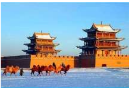
ด่านเจียยวี่กวน

พักที่ REZEN HOTEL ระดับ 4 ดาวท้องถิ่นหรือเทียบเท่าในเมือง เจียยวี่กวน