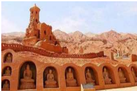
ถ้ำพระปีนอวค์

ค่ำ รับประทานอาหารค่ำ ณ ภัตตาคาร พักที่ HAMPTON BY HILTON HOTEL โรงแรมระดับ 4 ดาวหรือเทียบเท่าในเมืองอู่หลู่ฟาน