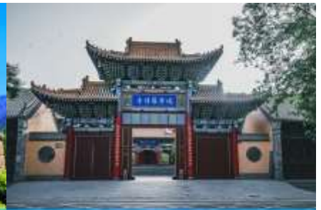
วัดจิ๋วหมิวหลิวสื่อ