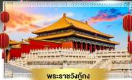
พระราชวังกู้กง