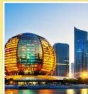
HANGZHOU CITY BALCONY