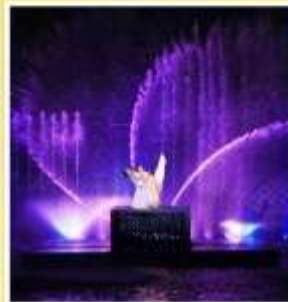
โชว์ MEET XISHI