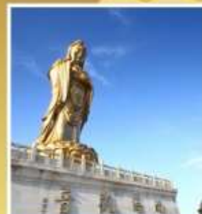
องค์เจ้าแม่กวนอิมหนานไห่