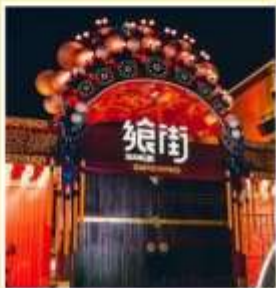
ถนนคนเดินกู่เยว่ GUYUE STREET