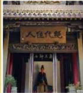
บ้านเกิด 4 ยอด หญิงงามไซซี