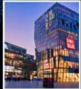
ย่านซานหลี่ถุน