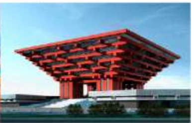
CHINA ART MUSEUM