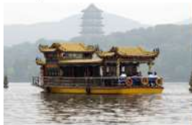
ล่องเรือชมทะเลสาบซีหู