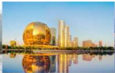
QIANJIANG NEW CITY