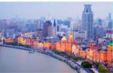
หาดไว่ถาน