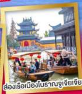
ล่องเรือเมืองโบราณจูเจียเจียว