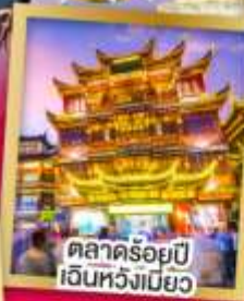
ตลาดร้อยปี เจินหวังเมียว