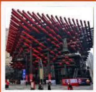
พิพิธภัณฑ์ศิลปะฉงชิ่ง