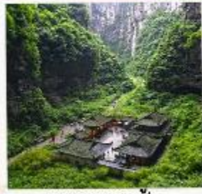
อุทยานหลุมฟ้า สะพานสวรรค์