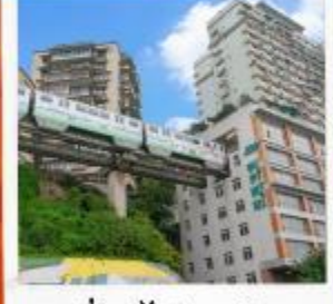
นั่งรถไฟทะลุตึก