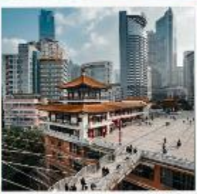
ตึกหุยซิง (ตึก 22 ชั้น)