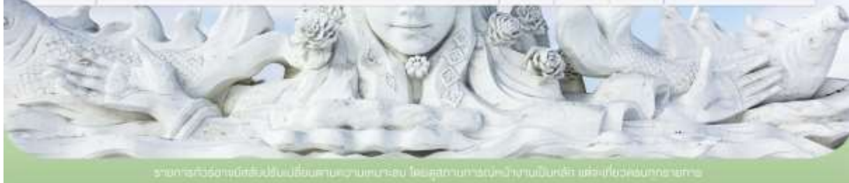
รายการทัวร์อาจมีข้อผิดพลาดโดยไม่另行通知 กรุณาตรวจสอบรายละเอียดก่อนจอง โดยดูสถานะทางเว็บไซต์ของบริษัทฯ เพื่อแก้ไขข้อผิดพลาดต่างๆ