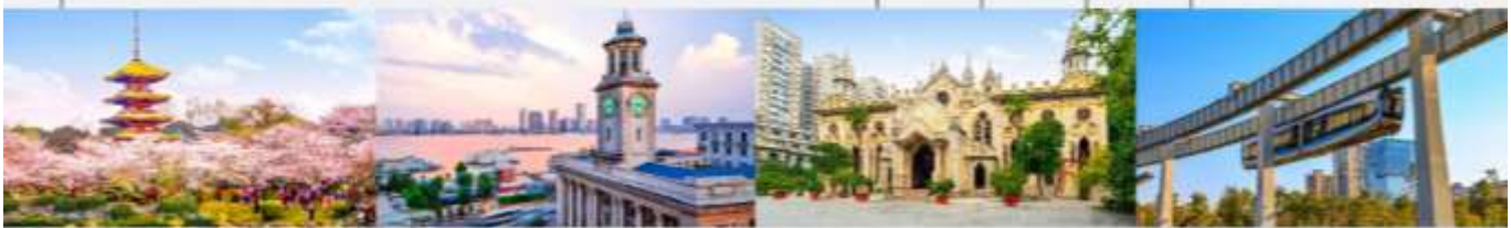
สวนชาทุระทะเลสาบโมซานตงหู