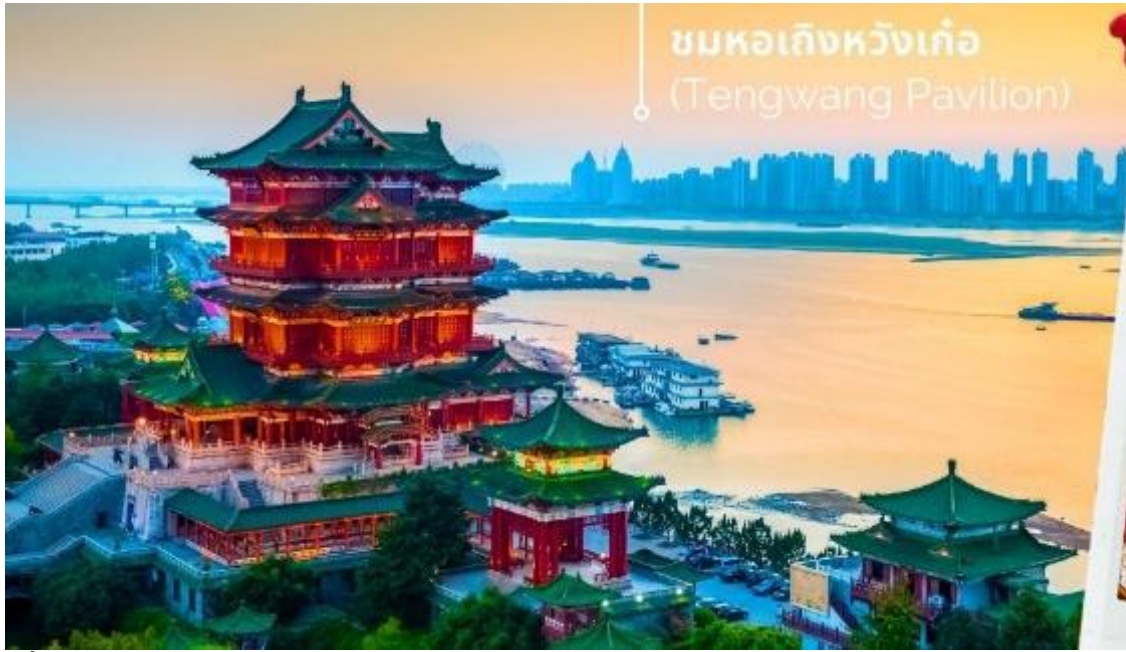
ชมหอเกิ่งหวังเก้อ (Tengwang Pavilion)

บทกวีและภาพฝาผนังสมัยราชวงศ์ถังและอื่นๆ 1 ใน 3 หอที่มีชื่อเสียงที่สุดในเมืองจินหนงสูง 9 ชั้น ริมฝั่งแม่น้ำกั้นเจียง ทางตะวันตกเฉียงเหนือของนครหนานชาง