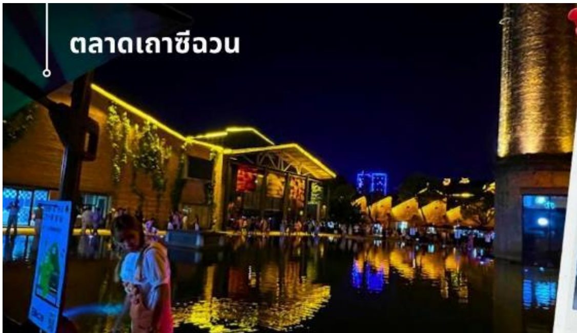
ตลาดเถาซีฉวน

จากนั้นออกเดินทางสู่ เมืองเจียงเต๋อเจิ้น ใช้เวลาเดินทางประมาณ 2 ชั่วโมงครึ่ง - 3 ชั่วโมง เมืองเจียงเต๋อเจิ้นเมืองที่มีชื่อเสียงทางด้านวัฒนธรรมและประวัติศาสตร์ เป็นแหล่งผลิตเครื่องเคลือบดินเผาที่ได้รับการยกย่องและชื่นชมจากทั่วโลก นำท่านเดินชม ตลาดพื้นเมืองเถาซีฉวน ที่เป็นย่านวัฒนธรรมและความคิดสร้างสรรค์คนรุ่นใหม่ ในใจกลางเมืองเจียงเต๋อเจิ้น มณฑลเจียงซี เป้าหมายเพื่อรองรับความต้องการของนักท่องเที่ยวที่เพิ่มมากขึ้น และเป็นประโยชน์ต่อผู้ประกอบการรุ่นใหม่ ๆ ของคนท้องถิ่น ภายในจะมีร้านค้าที่จัดแสดงและขายผลิตภัณฑ์เซรามิกต่างๆ มากมาย โดยที่นี่ ถือเป็นแหล่งรวมผลิตภัณฑ์เซรามิก ที่ออกแบบจากผู้ชื่นชอบ การสร้างสรรค์ผลงานด้านศิลปะผ่านผลงานเครื่องปั้นดินเผา