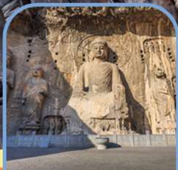
ถ้ำแกะสลักพาสินหลงเหมิน