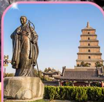
เจดีย์ห่านป่าใหญ่