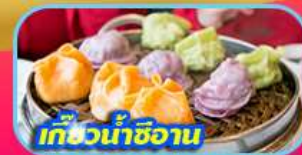
เกี๊ยวน้ำซีอาน