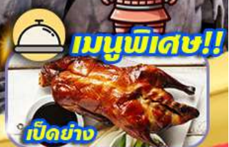
เมนูพิเศษ!! เป็ดปัก