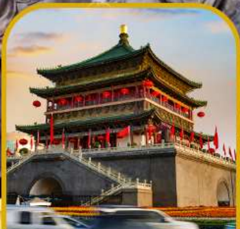
จัตุรัสหอกลอง หอระฆัง