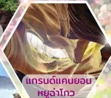
แกรนด์แคนยอนหยูจ่าโกว