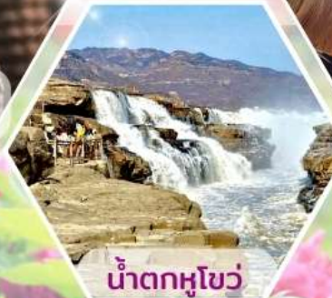
น้ำตกหูโซ่ว