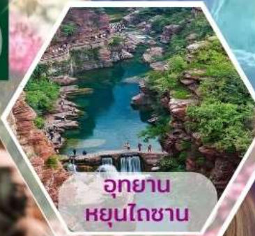
อุทยานหยุนโตซาน