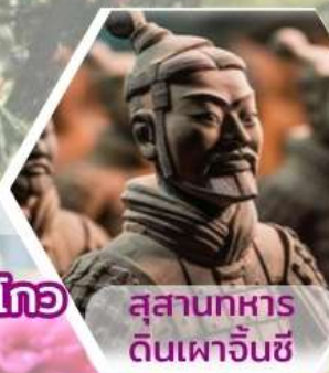
สุสานทหารดินเผาจีนซี