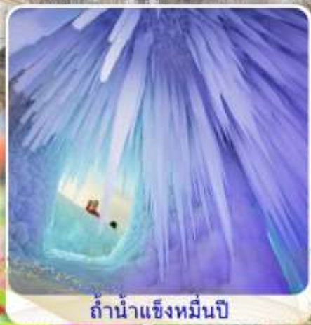
ถ้ำน้ำแข็งหมื่นปี