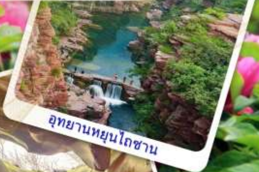
อุทยานหยุนโถซาน