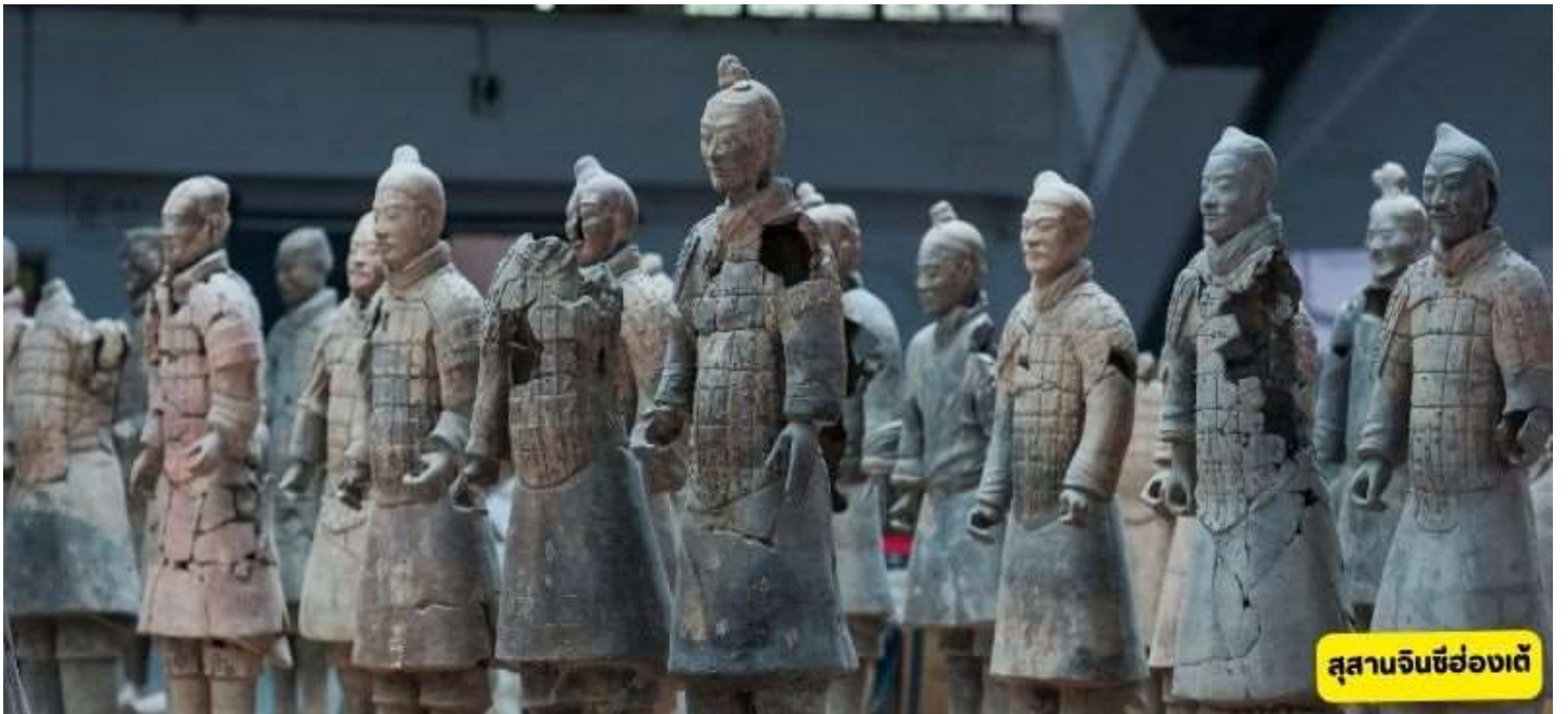
สุสานจินซีฮ่องเต้

สุสานจินซีฮ่องเต้ - วัดต้าเจี๋ยเอิน - เจดีย์ห่านป่าใหญ่ - ถนนต้าถังเมืองที่ไม่เคยหลับไหล