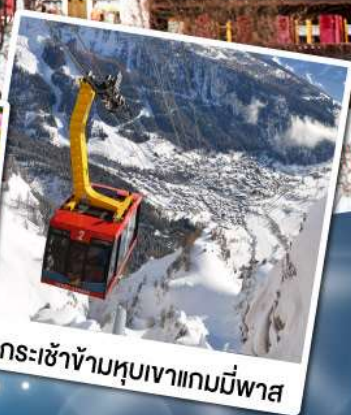
กระเช้าข้ามหุบเขาแกมมีพาส