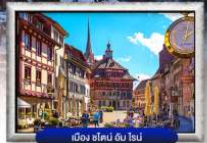
เมือง ช็อบบิง อัม โรน