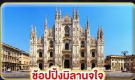
ช้อปปิ้งมิลานจุใจ

ที่สุดของธรรมชาติ แห่ง "ยุโรป" มากกว่าการท่องเที่ยว แต่ได้พักผ่อนเต็มที่ โปรแกรมไม่รีบเร่ง