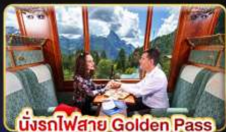
นั่งรถไฟสาย Golden Pass