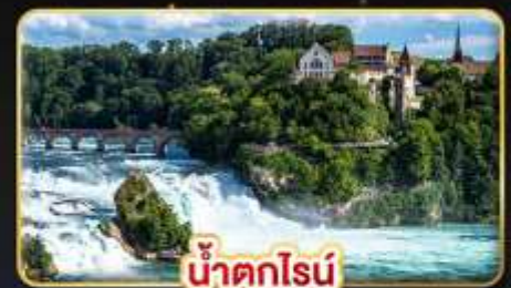
น้ำตกโรน