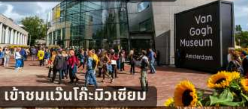
เข้าชมแวนโก๊ะมิวเซียม