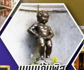
แมนเกินฟิส