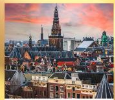
อัมสเตอร์ดัม