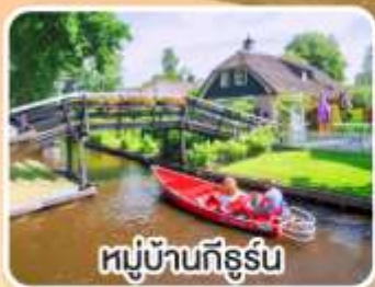
หมู่บ้านทึร์รูน