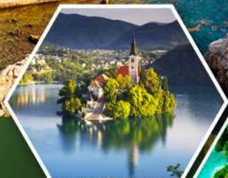
ทะเลสาบพลอด