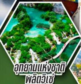
อุทยานแห่งชาติ พลิตวิเซ่