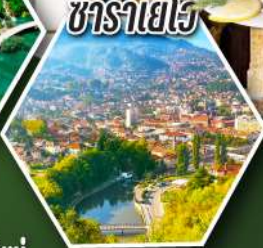
ซาราเยโว

• นั่งกระเช้าสู่ยอดเขาคูบรอฟนิค • ชิมหอยนางรมสดๆ เมืองสตอน