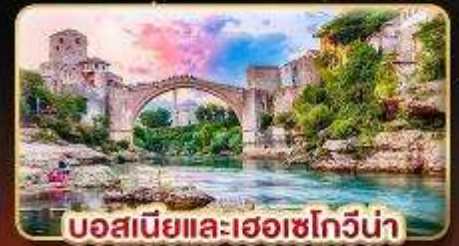
บอสเนียและเฮอร์เซโกวีนา