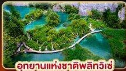
อุทยานแห่งชาติพลิกวิเช