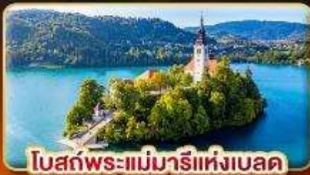
โบสถ์พระแม่มาเรียแห่งเบลด