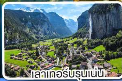
เลาเคอร์บรุนเนน