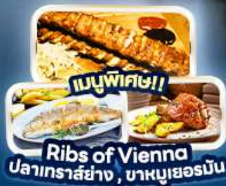
เมนูพิเศษ!! Ribs of Vienna ปลาเทราสย่าง, บาหมูเยอร์มัน