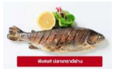
พิเศษ! ปลาเทราต์ย่าง

เย็น ๑๑ รับประทานอาหารเย็น (มื้อที่4) ที่พัก : Gartenhotel Maria Theresia หรือโรงแรมระดับใกล้เคียงกัน (ชื่อโรงแรมที่ท่านพัก ทางบริษัทจะทำการแจ้งพร้อมใบนัดหมาย 5-7 วัน ก่อนวันเดินทาง)