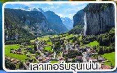
เลาเทอ์บรุนเนน