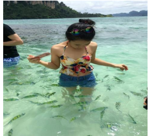
ชมทะเลแหวกUnseen in Thailand เชื่อมระหว่างเกาะทับ และเกาะหม้อ