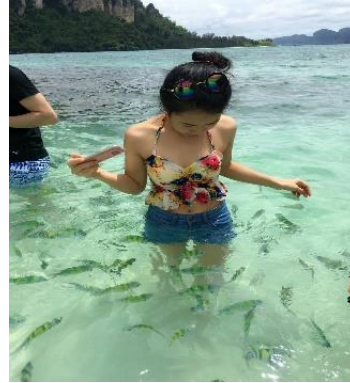
ชมทะเลแหวก Unseen in Thailand เชื่อมระหว่าง เกาะทับ และ เกาะหม้อ