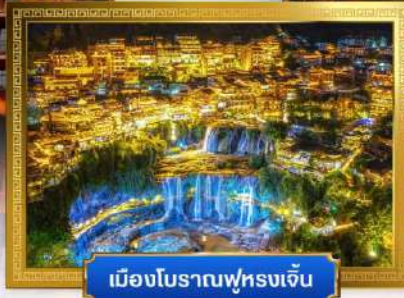
เมืองโบราณฟูหลงเจิ้น