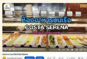
ห้องอาหารบนเรือ