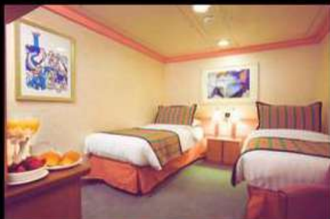
INSIDE ไม่มีย่านต่าง