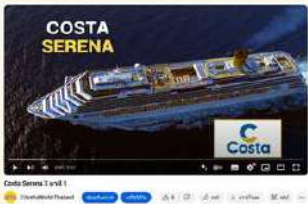
เกี่ยวกับเรือ