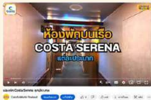
ห้องพักรบนเรือ