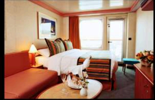
BALCONY มีระเบียง