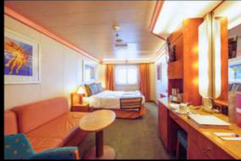
OCEAN VIEW มีหน้าต่าง