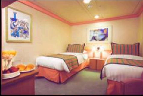
INSIDE ไม่มีหน้าต่าง