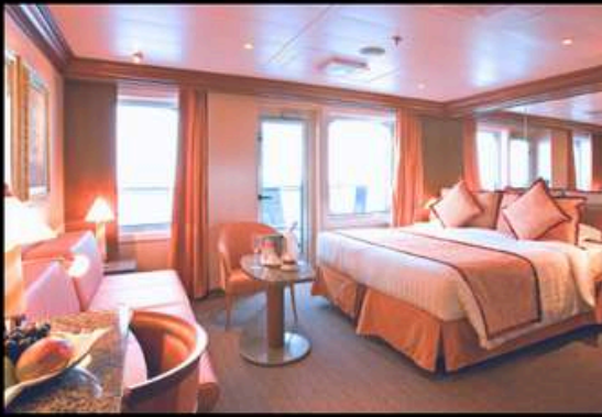
MINI SUITE มีนิสวิต