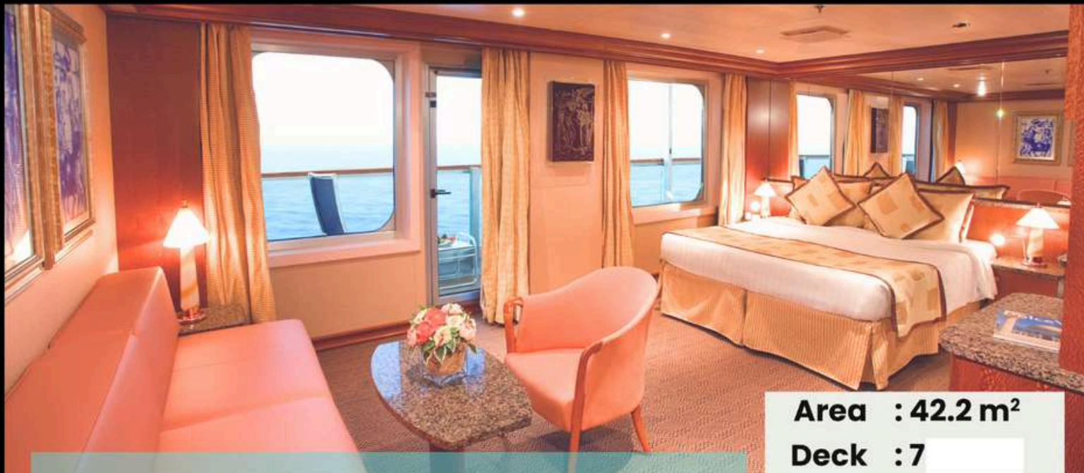
Grand Suite แกรนด์ สวิต