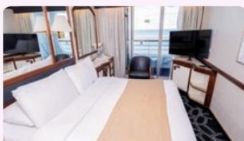
BALCONY DELUXE / BALCONY STATEROOM