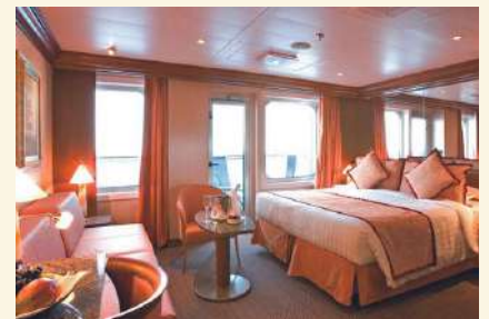
ดูรูปภาพห้องพัก