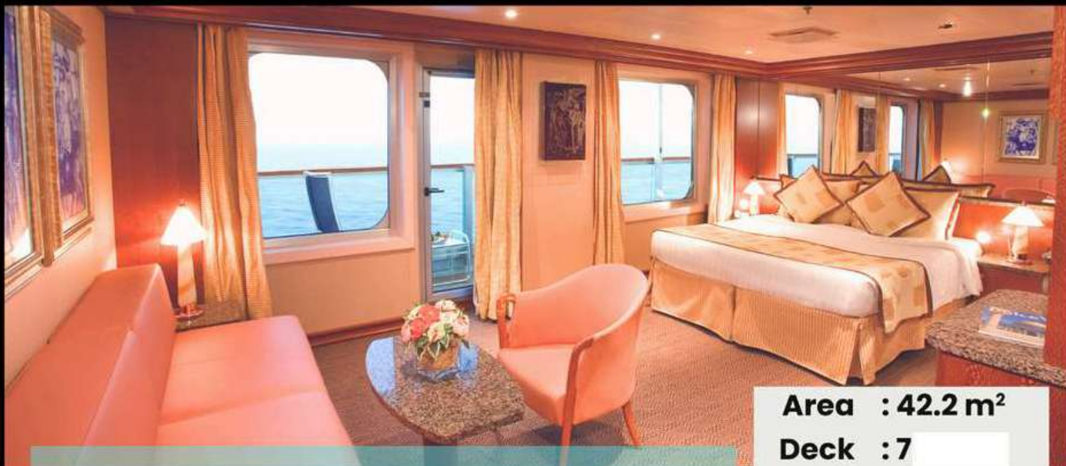
Grand Suite แกรนด์ สวิต