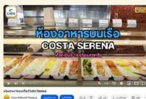
ห้องอาหารบนเรือ