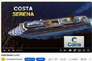
เกี่ยวกับเรือ