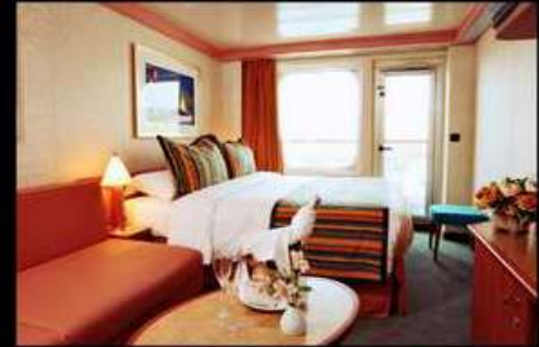
BALCONY มีระเบียง