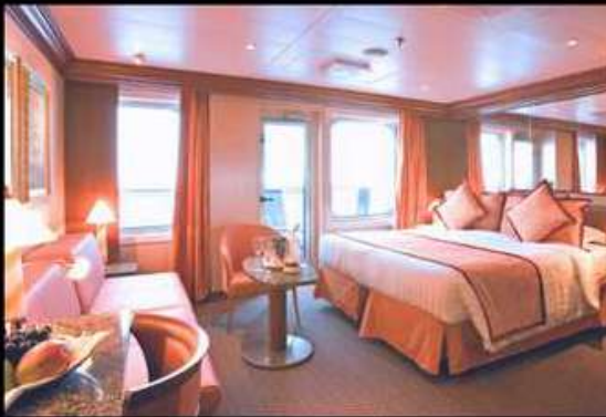
MINI SUITE มีนิสวิต