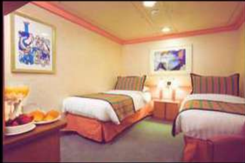
INSIDE ไม่มีย่านต่าง