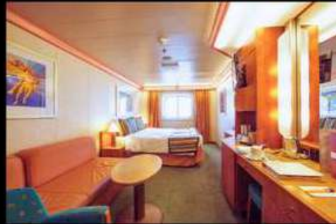
OCEAN VIEW มีย่านต่าง